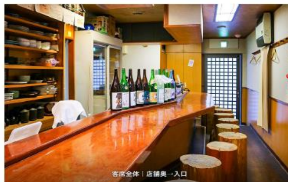
客席全体 | 店舗奥一入口